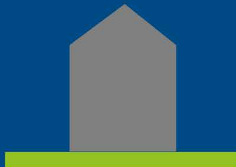
COSTRUIRE EX NOVO