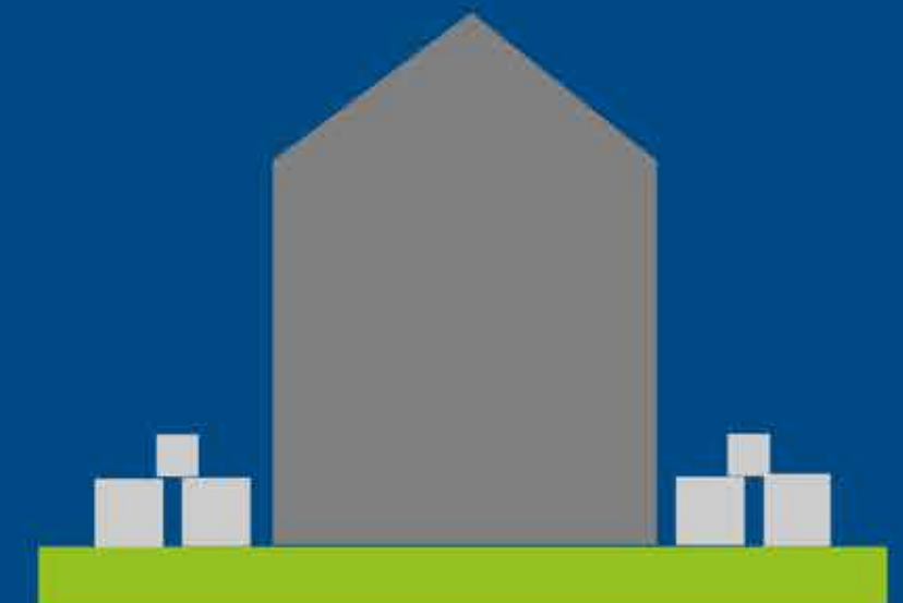
DEMOLIRE E RICOSTRUIRE